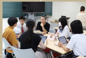
成長実感発表会チーム