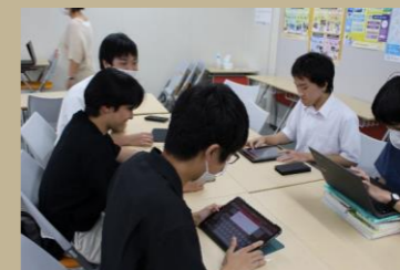
スマホ相談会チーム