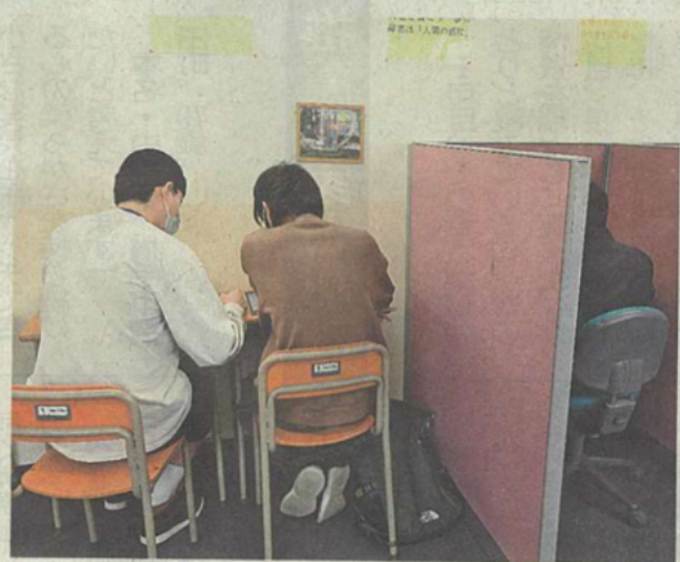
自習室で学習する生徒。6月上旬、秋田市広面の第一学院高校秋田キャンパス

インの配信授業やレポート提出、対面での指導を組み合わせて学習する。通学頻度は、心身の状態に合わせて、週0〜5日のいずれかを選ぶことができる。